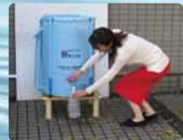
ペットボトルで給水